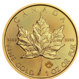
Kanadischer Maple Leaf

Physische Goldprodukte sind immer eine gute Entscheidung. Diese können Sie sogar zu Hause lagern. So sind sie immer griffbereit. Generell können Sie sich zwischen Goldbarren / Combibarren und Goldmünzen entscheiden. Die Goldmünzen lassen sich sehr leichter verkaufen. Es gibt ein Anlagemünzen und Sammlermünzen, die sich global einer hohen Nachfrage erfreuen und höhere Wertsteigerungen erzielen lassen: