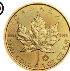
1 Unze Gold Maple Leaf 2022