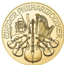
Wiener Philharmoniker aus Österreich