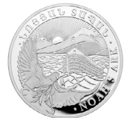
1 Unze Silber Arche Noah 2022